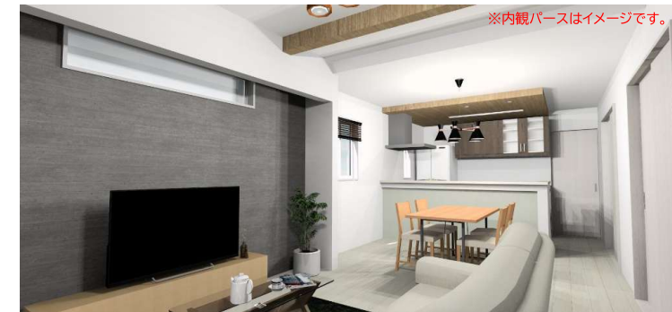
※内観パースはイメージです。

太陽光から様々な色を映し出すprismのように、 priSUMA～プリズマ～はあなたの新しい日常を彩ります。